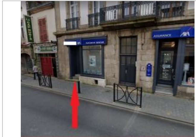
trottoir devant le n°24 rue de Brest