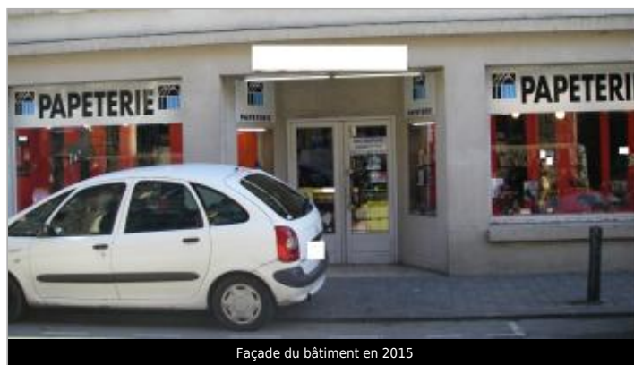
Façade du bâtiment en 2015

GÉOLOCALISATION Coordonnées WGS84 : X: -3.82836170 / Y: 48.57637400 Coordonnées RGF93 (Lambert 93) X: 196910.88 / Y: 6852450.5 Coordonnées RGF93 (ETRS89) : X: -3.8283617 / Y: 48.576374 Code Hydro: J2614000 Rive de référence: Gauche