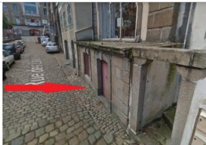
milieu de la rue des Lavoirs