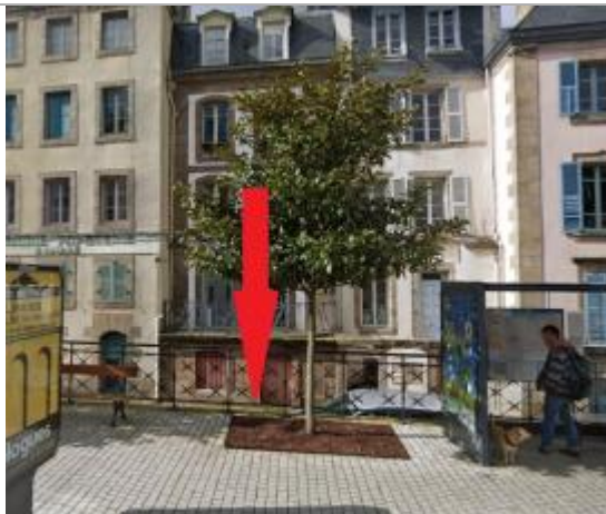
milieu de la rue des Lavoirs