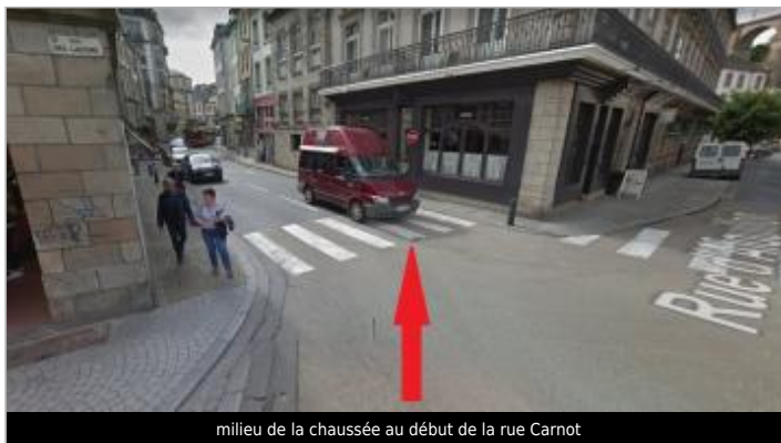
milieu de la chaussée au début de la rue Carnot

GÉOLOCALISATION Coordonnées WGS84 : X: -3.82717770 / Y: 48.57745060 Coordonnées RGF93 (Lambert 93) X: 197008.23 / Y: 6852562.19 Coordonnées RGF93 (ETRS89) : X: -3.8271777 / Y: 48.5774506 Code Hydro: J26-0300 Rive de référence: Droite