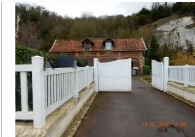
15 Quai de Caumont

Coordonnées WGS84 : X: 0.92569487 / Y: 49.35560700