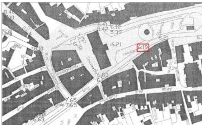
Relevé de la ville de Morlaix

Texte : Inondation 12 décembre 2000 : 6.19