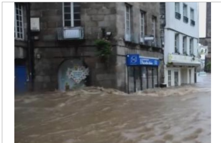
Photographie du site lors de l'inondation