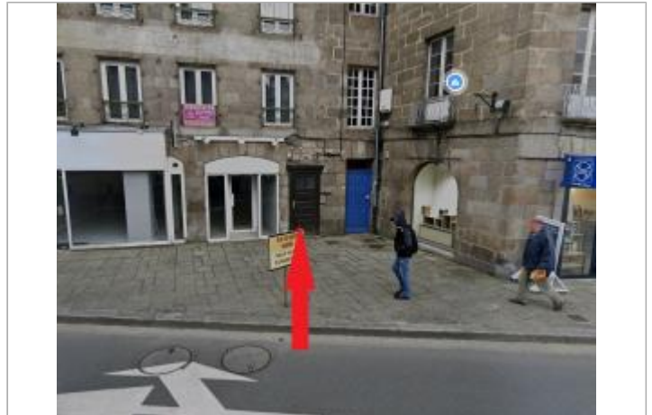
Vue d'ensemble du 37 place des otages