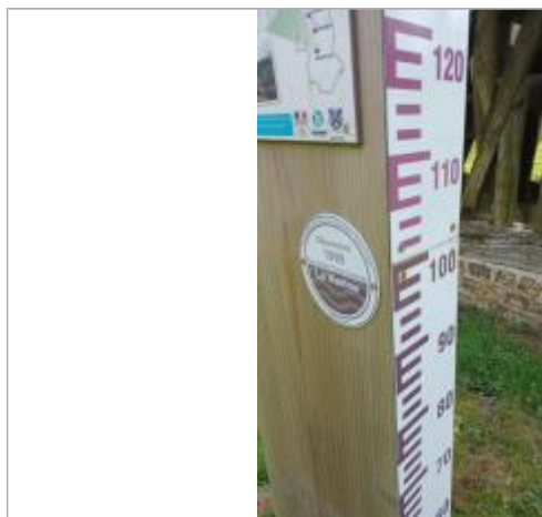
Le repère de crue est placé sur un totem situé devant le puits de la commune à 98 cm/échelle limnimétrique.

NIVELLEMENT SPC SACN. LE SPC N'EST PAS GÉOMÈTRE EXPERT, LES COTES SONT DONNÉES À TITRE INDICATIF. - 21/09/2022