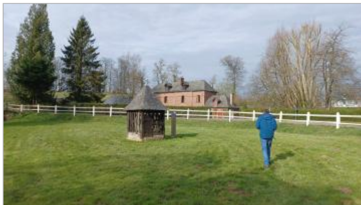
Totem à proximité du puits situé près du carrefour de la D23 avec la D50