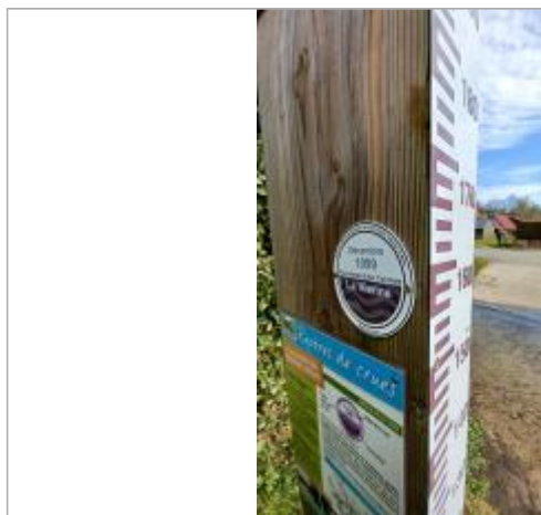
Le repère de crue est placé sur un totem à proximité du cours d'eau à 158 cm/échelle limnimétrique.

NIVELLEMENT SPC SACN. LE SPC N'EST PAS GÉOMÈTRE EXPERT, LES COTES SONT DONNÉES À TITRES INDICATIF. - 21/09/2022