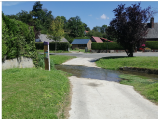
A proximité du gué de Saint-Mards