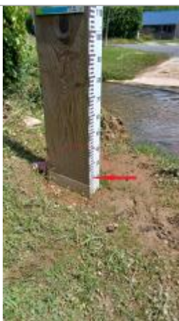
Laisse de crue à 17 cm/sol.

Altitude calculée de l'eau (en m) : 78.81