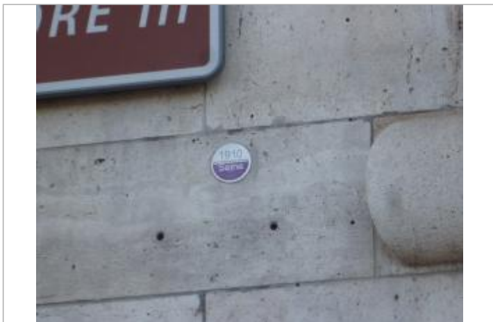
Repère de crue 100ale