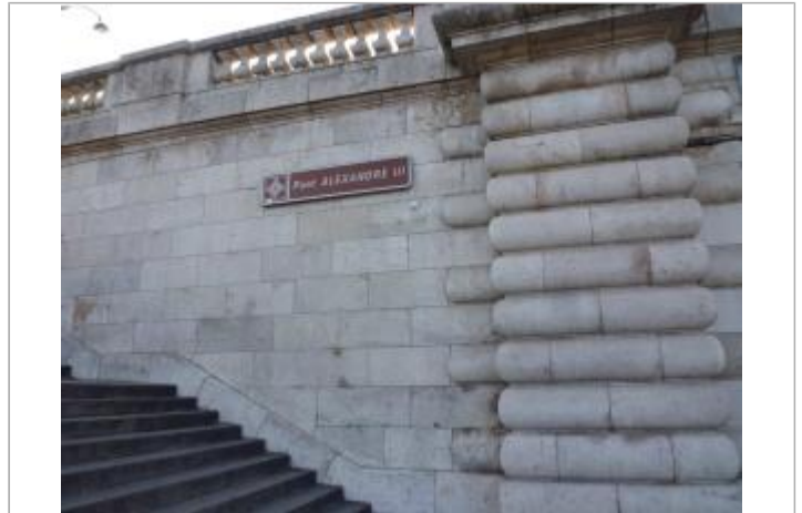
En bas des escaliers Ouest