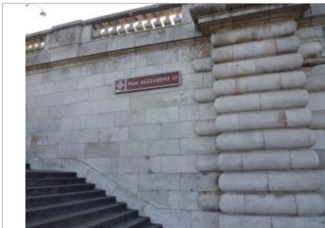
En bas des escaliers Ouest