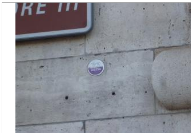
Repère de crue 100ale