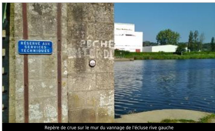
Repère de crue sur le mur du vannage de l'écluse rive gauche