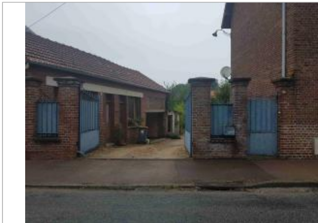
813 rue de Verdun

Coordonnées WGS84 : X: 0.87931475 / Y: 49.48708700