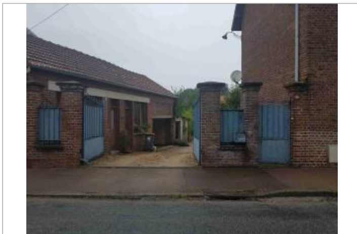
813 rue de Verdun