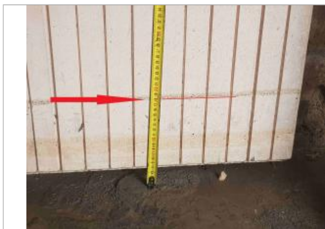
Laisse de crue sur porte du garage à 18 cm/sol

NIVELLEMENT SPC SACN. LE SPC N'EST PAS GÉOMÈTRE EXPERT, LES COTES SONT DONNÉES À TITRES INDICATIF. - 28/05/2021