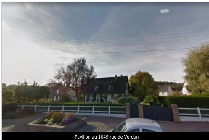
Pavillon au 1049 rue de Verdun