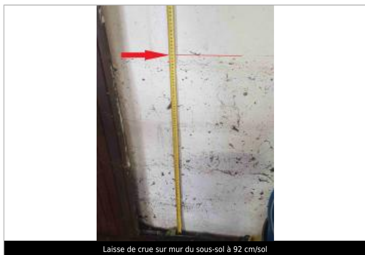
Laisse de crue sur mur du sous-sol à 92 cm/sol

NIVELLEMENT SPC SACN. LE SPC N'EST PAS GÉOMÈTRE EXPERT, LES COTES SONT DONNÉES À TITRES INDICATIF. - 28/05/2021