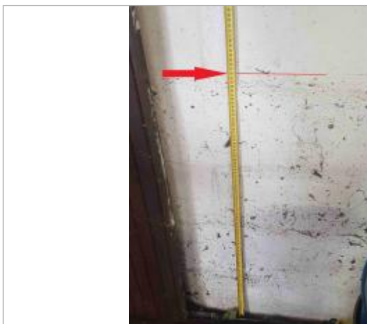
Laisse de crue sur mur du sous-sol à 92 cm/sol

NIVELLEMENT SPC SACN. LE SPC N'EST PAS GÉOMÈTRE EXPERT, LES COTES SONT DONNÉES À TITRES INDICATIF. - 28/05/2021