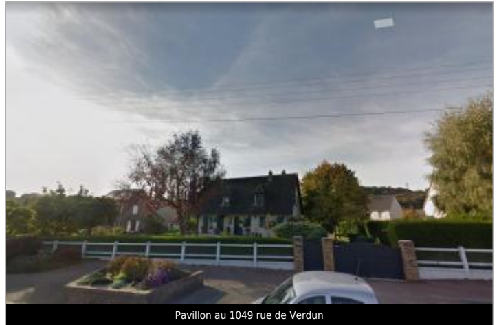
Pavillon au 1049 rue de Verdun

Coordonnées WGS84 : X: 0.88103663 / Y: 49.48887800