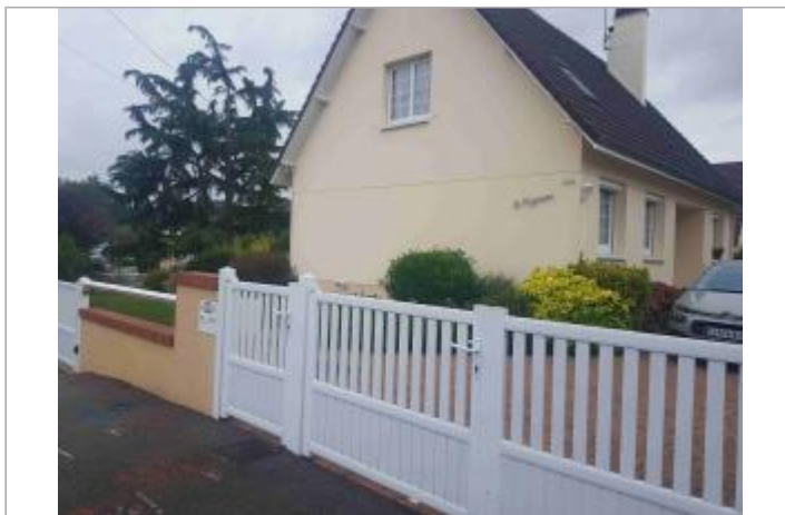
Pavillon au 263 rue Gustave Flaubert