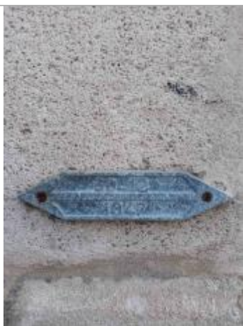
Plaque gravée du 30/12/1947