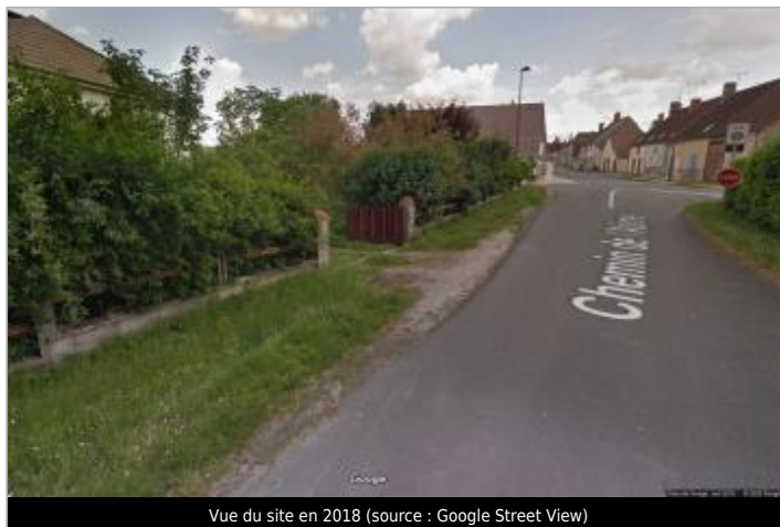
Vue du site en 2018