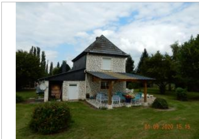
3107 Le Conihout