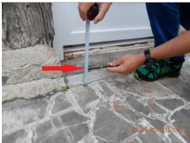
Laisse de crue à 10 cm du sol de la terrasse devant la porte fenêtre