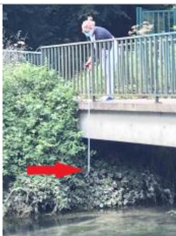
Trace de boue sur la végétation sur la berge, à 117 cm du rebord du sol (ou l'on marche) du pont

Altitude calculée de l'eau (en m) : 46.536