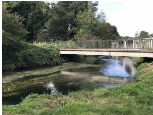
Passerelle impasse Jules Ferry

Coordonnées WGS84 : X: 0.95709855 / Y: 49.55024400