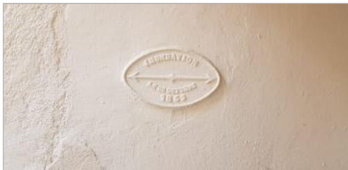
Repère de crue gravé sur la façade à l'intérieur de la cour (propriété privée)