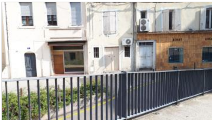
Vue du repère de crue (à gauche) de la rue piétonne le long de l'Avenue de l'Europe