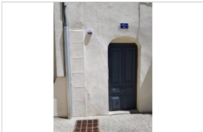
Vue éloignée du repère de crue