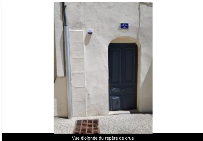
Vue éloignée du repère de crue