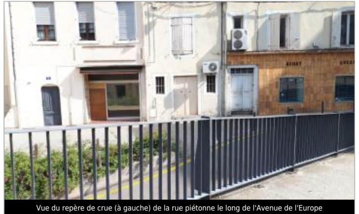
Vue du repère de crue (à gauche) de la rue piétonne le long de l'Avenue de l'Europe