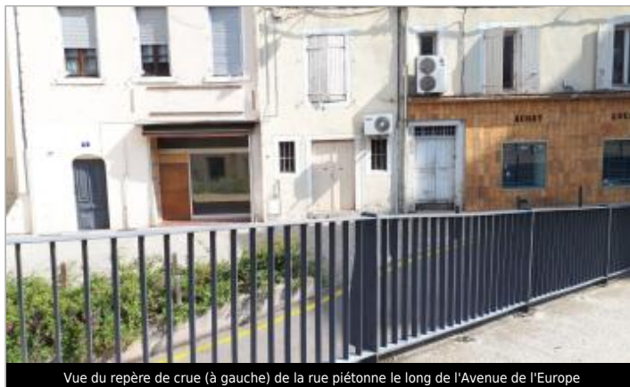
Vue du repère de crue (à gauche) de la rue piétonne le long de l'Avenue de l'Europe