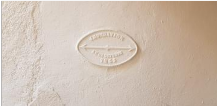
Repère de crue gravé sur la façade à l'intérieur de la cour (propriété privée)