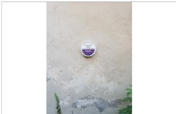
Repère de crue, jour de pose