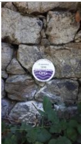
Repère de crue, jour de pose