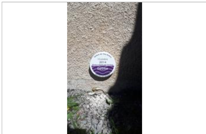
Repère de crue, jour de pose