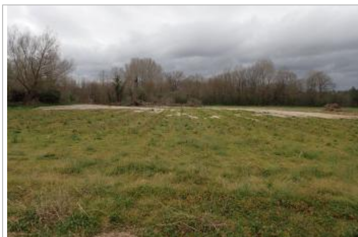
Bord de la D40