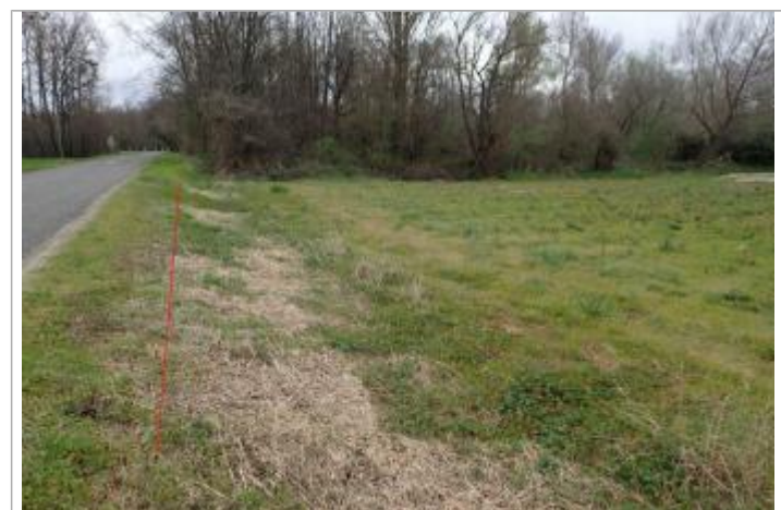
Débris végétaux au sol