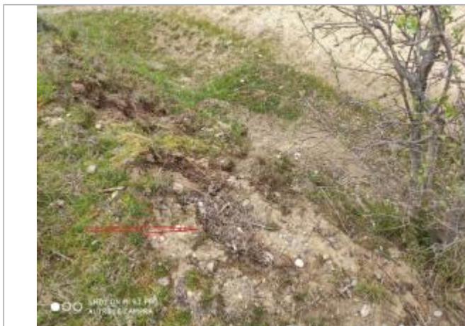
Contre-bas de la piste de la sablière de Mondoune