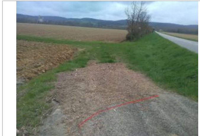
Chemin d'accès agricole au bord de la D206

Coordonnées WGS84 : X: 1.78416040 / Y: 43.08606320