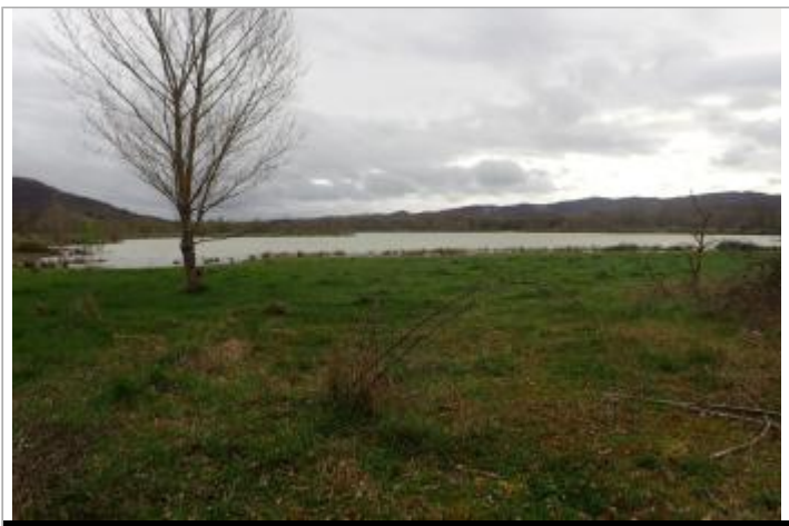
Bord de la sablière du lieu-dit Mondoune

GÉOLOCALISATION Coordonnées WGS84 : X: 1.79632637 / Y: 43.08344160 Coordonnées RGF93 (Lambert 93) X: 601908.83 / Y: 6221209.06 Coordonnées RGF93 (ETRS89) : X: 1.7963264 / Y: 43.0834416 Code Hydro: O1--0290 Rive de référence: Droite