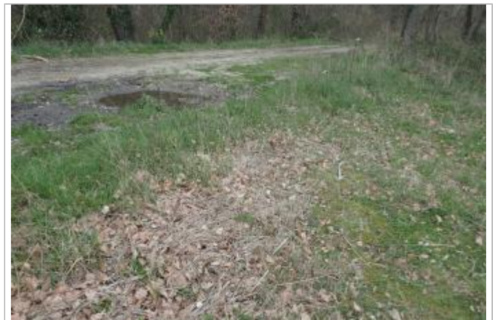
Débris végétaux au sol

GÉNÉRAL Code : GTL_R_10015_1 Date de mise à jour : 12/09/2020 Auteur : SPC GTL