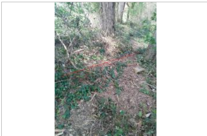
Digue près de la D16