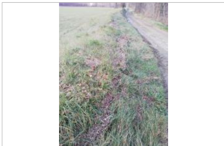
Débris végétaux sur la digue

Altitude calculée de l'eau (en m) : 358.11 m