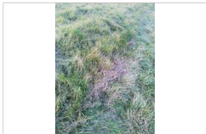
Débris végétaux sur la digue