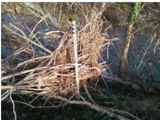
Laisse de crue dans la végétation

Altitude calculée de l'eau (en m) : 356.98 m