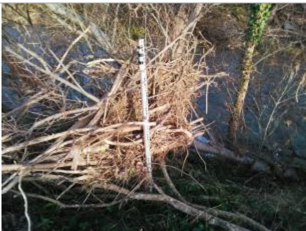
Laisse de crue dans la végétation

Altitude calculée de l'eau (en m) : 356.98 m