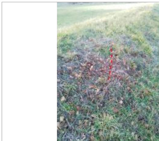
Digue en rive gauche

Coordonnées WGS84 : X: 1.98863447 / Y: 43.00624560