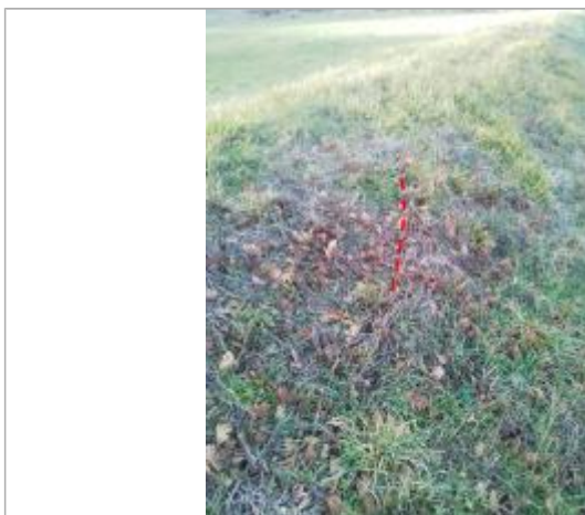
Débris végétaux sur la digue