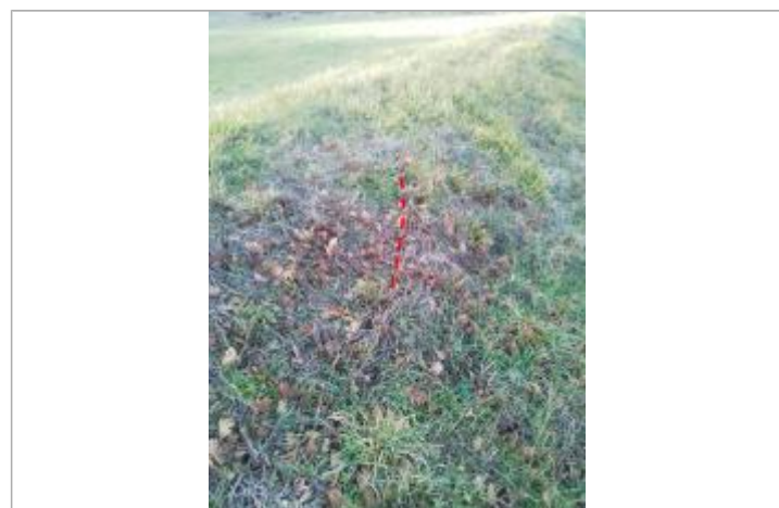
Débris végétaux sur la digue