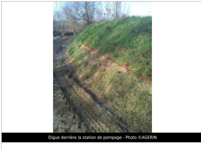
Digue derrière la station de pompage