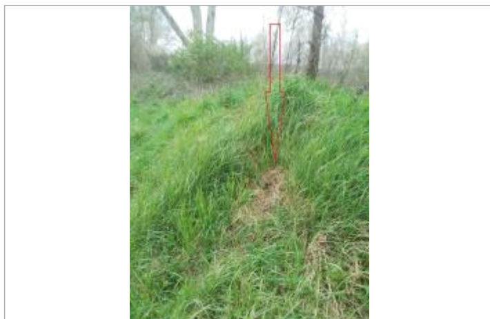
Débris végétaux en haut de talus