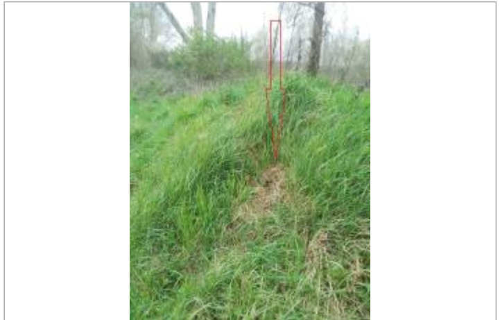
Talus lieu-dit Bouzigues - Photo ©AGERIN

Coordonnées WGS84 : X: 1.92364567 / Y: 43.08713700