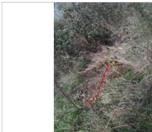
Débris végétaux en haut de berge