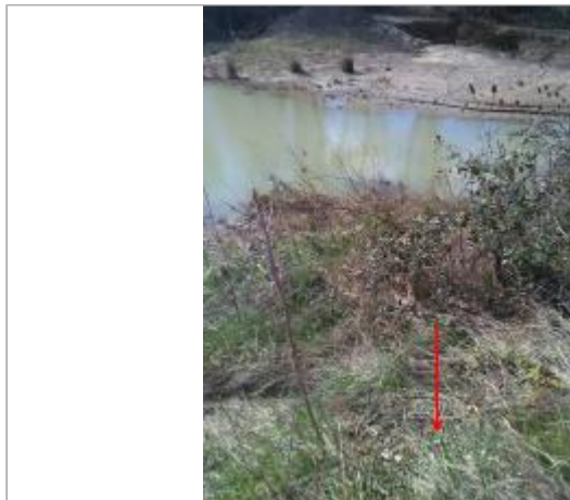
Lac de Parets

Coordonnées WGS84 : X: 1.93219966 / Y: 43.08583470