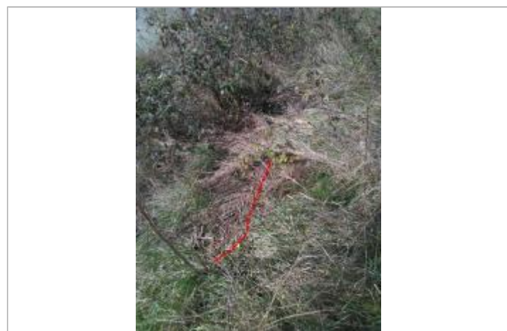
Débris végétaux en haut de berge