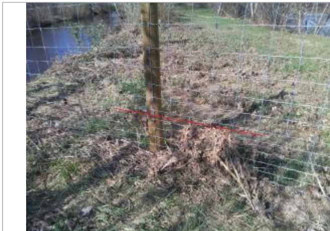
Grillage entre le lac de Pradet et le lac du domaine de Bedou

Coordonnées WGS84 : X: 1.93117201 / Y: 43.08563380