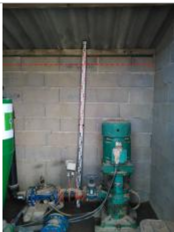
Laisse de crue sur le mur intérieur de la cabane

Altitude calculée de l'eau (en m) : 308.63 m