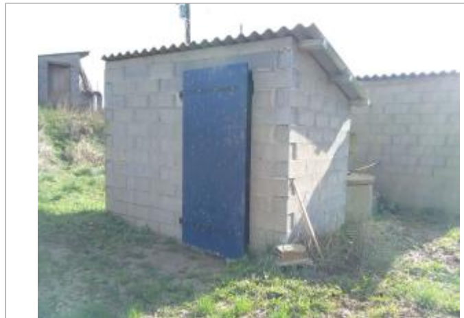
Cabane station de pompage vergers Bedou