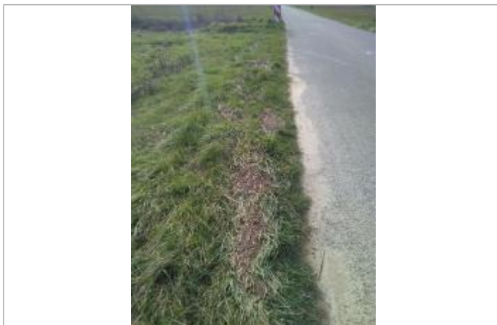
Bord de la D507

Coordonnées WGS84 : X: 1.93320875 / Y: 43.06555950