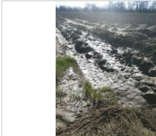
Champs près de la station d'épuration

Coordonnées WGS84 : X: 1.76343992 / Y: 43.08685830