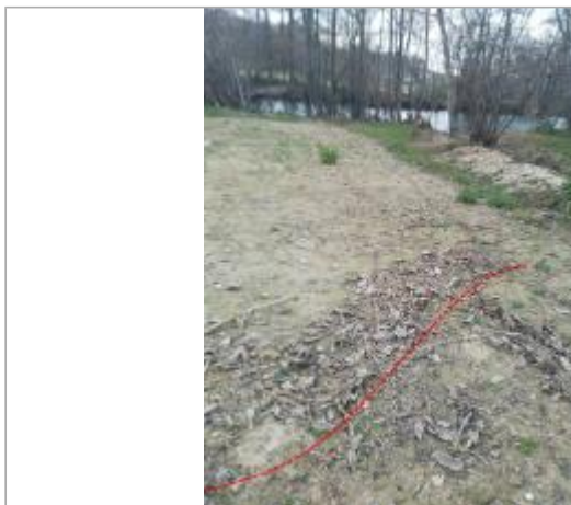
Champs au bord de la D106 - Photo ©AGERIN

Coordonnées WGS84 : X: 1.94346371 / Y: 43.07150740