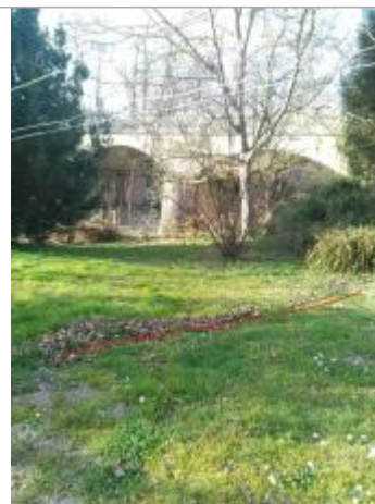
Jardin du café du pont - Photo ©AGERIN

Coordonnées WGS84 : X: 1.94388934 / Y: 43.07404880