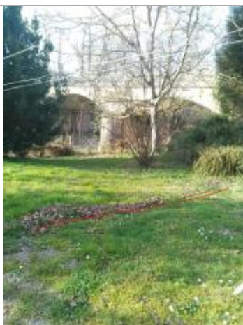
Débris végétaux au sol