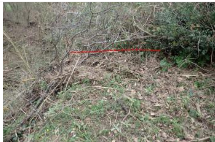
Débris végétaux sur la végétation

Altitude calculée de l'eau (en m) : 289.92 m