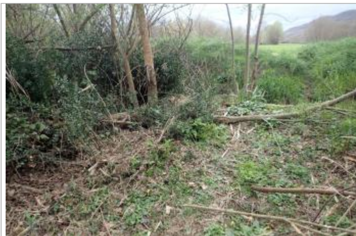
Ruisseau de Séguier