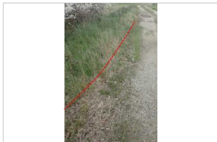
Débris végétaux en bord de chemin