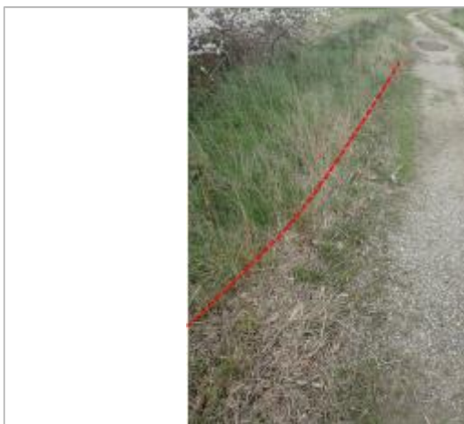
Débris végétaux en bord de chemin