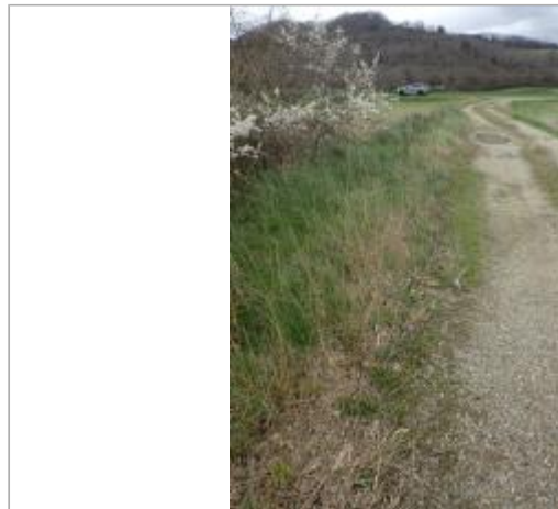
Chemin gravière