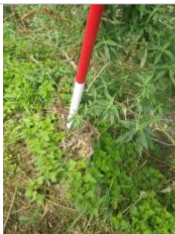
Débris végétaux en haut de berge

Altitude calculée de l'eau (en m) : 293.44 m