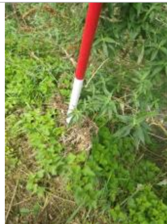
Berges - bout du chemin de l'Hers