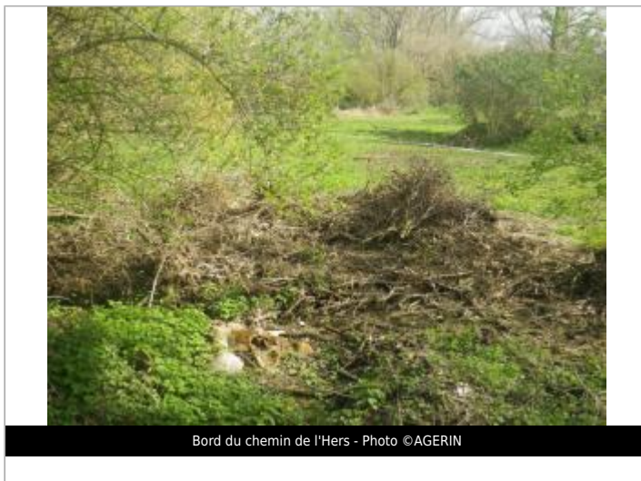
Bord du chemin de l'Hers