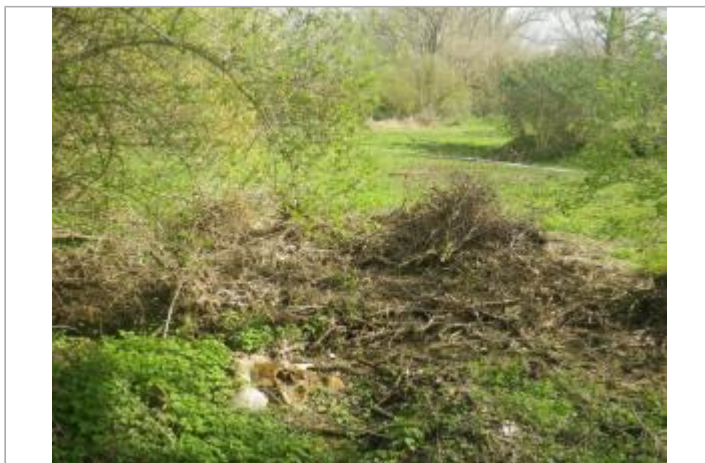
Bord du chemin de l'Hers