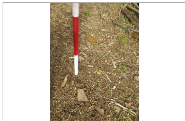
Débris végétaux au sol

GÉNÉRAL Code : GTL_R_9949_1 Date de mise à jour : 28/09/2020 Auteur : SPC GTL