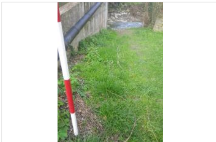
Berge Le Countirou