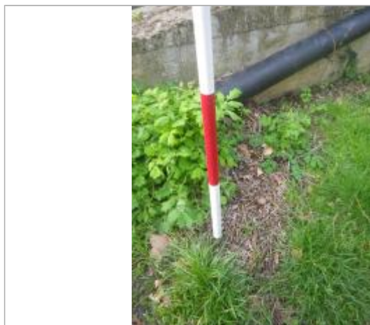
Débris végétaux haut de berge