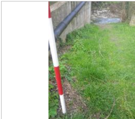
Berge Le Countirou

Coordonnées WGS84 : X: 1.87940056 / Y: 43.08998950