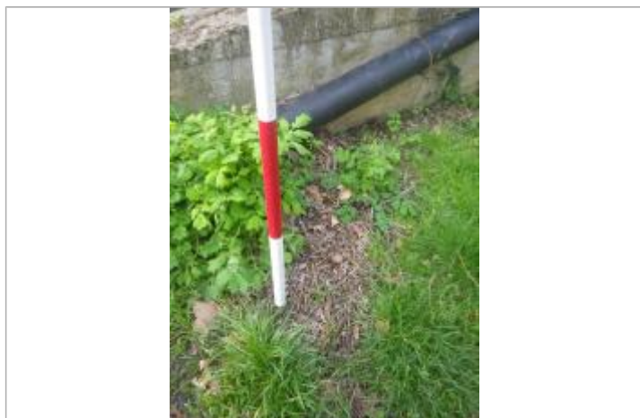
Débris végétaux haut de berge - Photo ©AGERIN

Altitude calculée de l'eau (en m) : 298.38 m