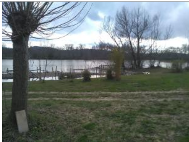
Lac de Latournerie