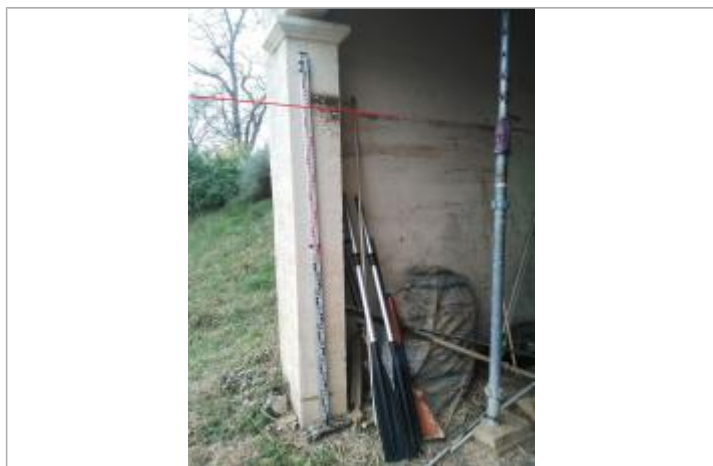
Laisse de crue - sous sol de la maison

Altitude calculée de l'eau (en m) : 307.73 m